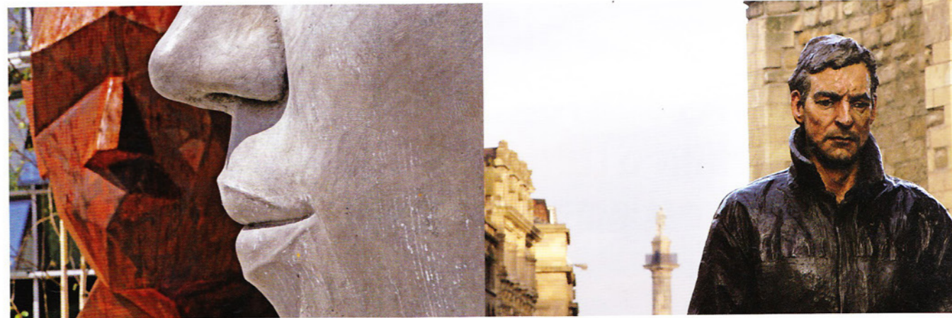
英格兰北部的城市雕塑项目

响应政府号召的艺术家之一，将他为英格兰东北部地区量身打造的雕塑方案——《北方天使》提交给了当地的政府，这一方案顺利得到了政府部门的认可，并得以实施。当《北方天使》这件雕塑成功地矗立在当地山丘之上时，在民众间引起了轰动性的影响，并迅速成为了城市地标，迎来了大量的旅游观光客。有时，我们不得不感慨艺术的力量。一件伟大的作品可以跨越很多障碍，它的存在直接向人们展示了艺术重塑城市的力量，以及艺术对于城市经济可能带来的转变。