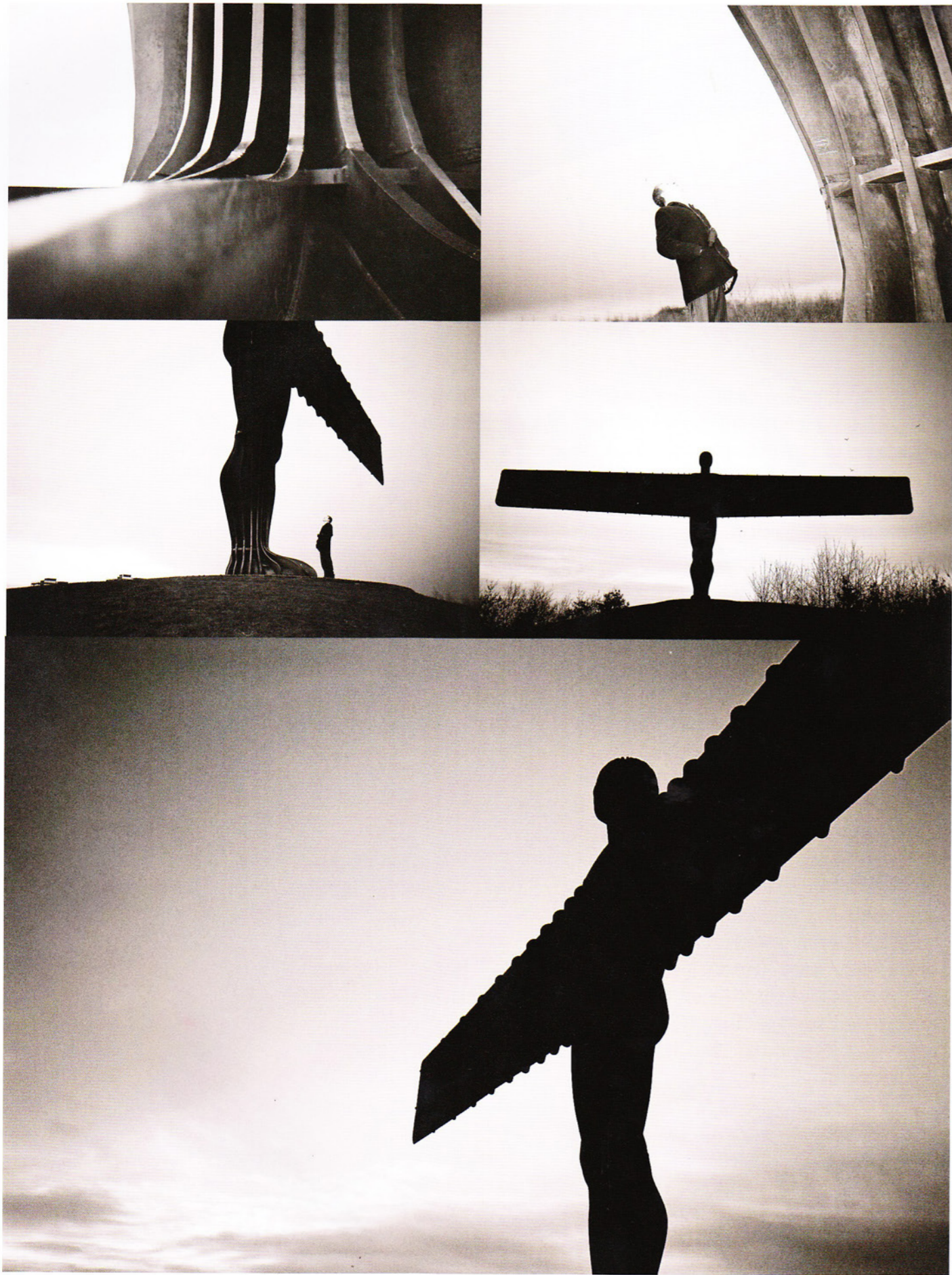
安东尼·高姆利《北方天使》